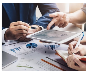
AUDITING A CONTROLLING