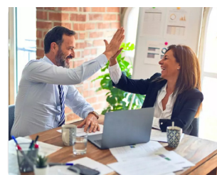
DANĚ A DAŇOVÉ SYSTÉMY