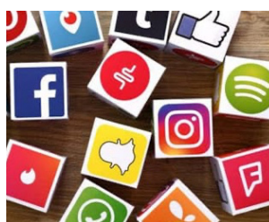
SOCIAL MEDIA MARKETING